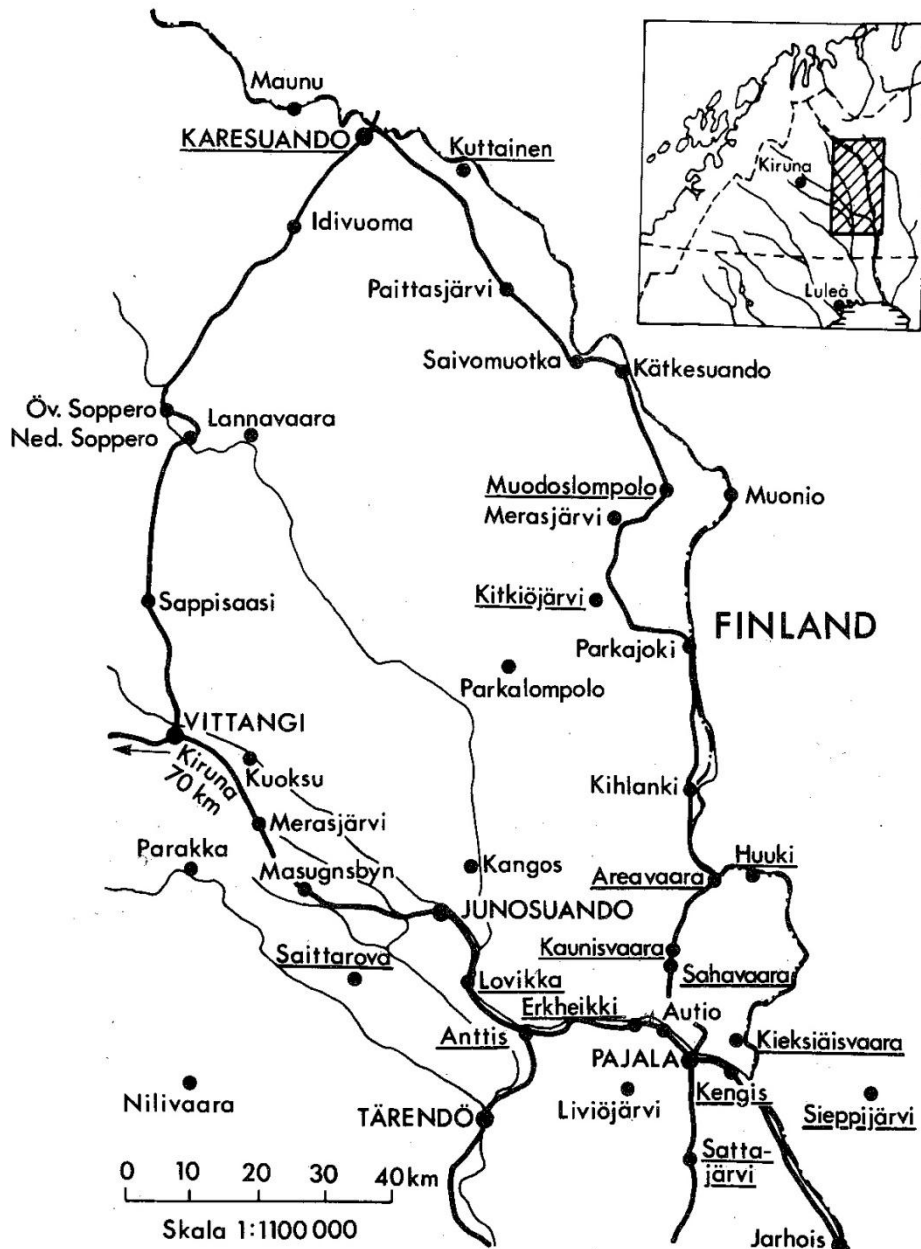
Korpela-rörelsens utbredning i övre Tornedalen. De byar där den väckte mest uppmärksamhet är understrukna.