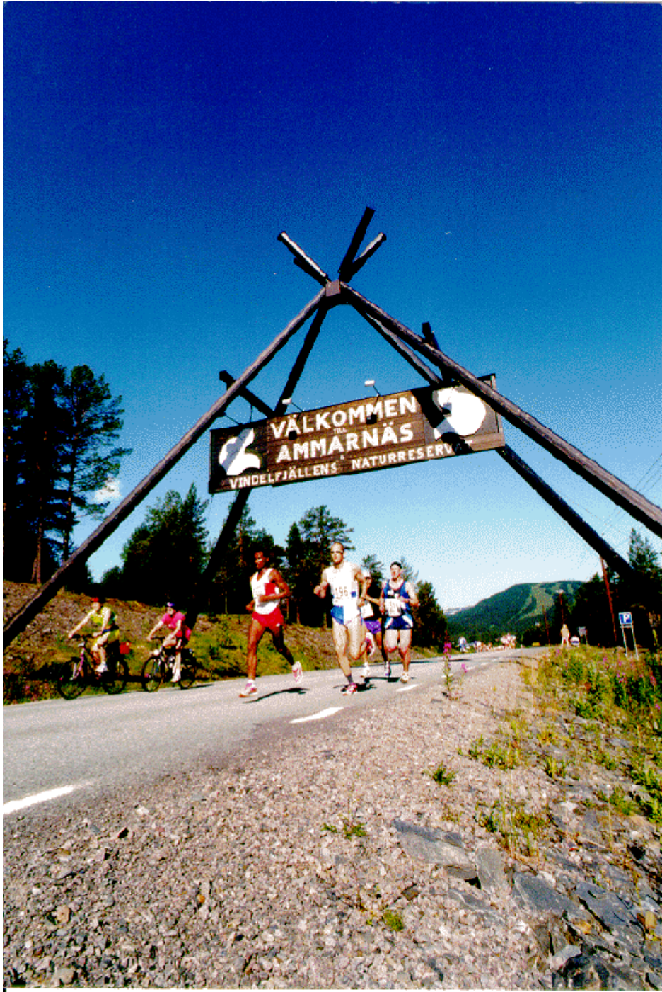
Figur 2. Vindelälvsloppet 1997, strax efter starten av första dagsetappen i Ammarnäs.

Totalt har 67 svar avgivits. Antalet självskattade lagledare hos de som besvarat enkäten uppgår till 475. Om denna självskattning stämmer så betyder detta att enkätsvaren representerar 12 procent av den sammanlagda lagledarinsatsen. En kortare sammanfattning av enkäten skickades ut till de svarande som uppgivit e-adress, den 7 juli 2011.