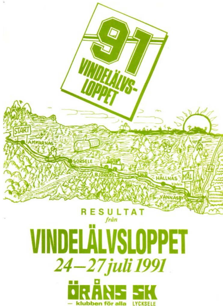
Figur 3. Framsidan på resultatsammanställningen av Vindelälvsloppet 1991.