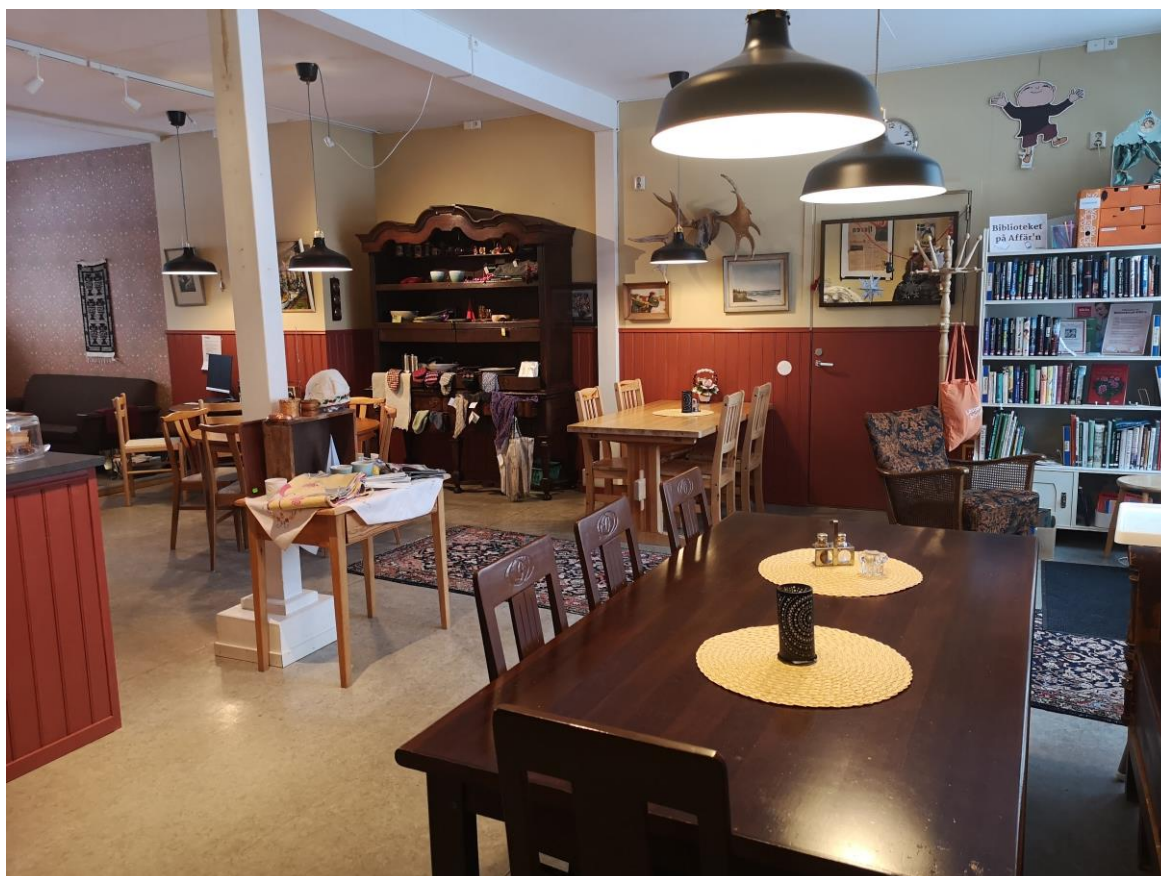
Bild 1 , En butik med tillhörande café kan utgöra ett socialt nav men också fungera som en given samlingsplats vid en större kris. Bilden är från Borgvattnet.

För en butiksägare som investerat i SOT-arbetet handlar det givetvis om en egen försäkran, att ha en container med ett reservkraftaggregat i anslutning till sin butik innebär en försäkran om att inte elen försvinner och butiken måste stängas ner och varor måste kastas. Utöver det tillkommer just det sociala ansvarstagandet, och som också manifesterades vid skogsbränderna. Följande citat kommer utifrån diskussionerna i Lillhärdal ” SOT är ju inte bara för min skull, utan det är ju för hela samhället ”. (Intervju, Lillhärdal)