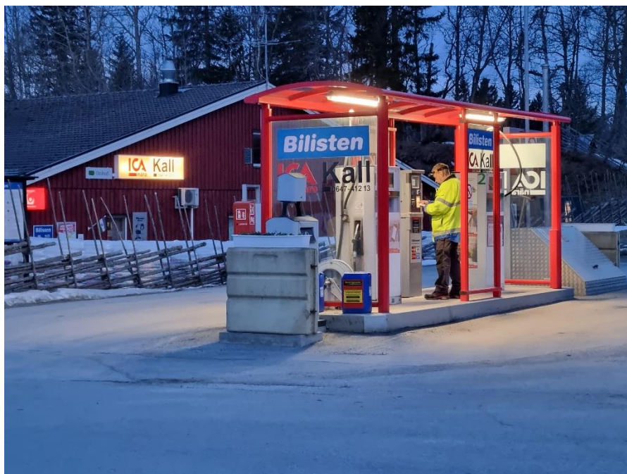
Bild 2 , Vid ett elavbrott i maj 2023 i Kallbygden. Reservaggregatet aktiverades vilket gjorde att butiken slapp få varor förstörda och det gick att fortsätta att tanka.

SOT bidrar således med att skapa en trygghet för butiksägare och civilsamhället men det finns också förtjänster som riktar sig till kommunen. ”Det största värdet är att det skapar en ömsesidig trygghet både för byn och för kommunen. Det blir ett stabilt läge” (Intervju, Härjedalens kommun). Från kommuners perspektiv beskrivs SOT som en förlängd arm åt båda håll. Vid en större händelse är kriskommunikation en central del. Man vill ha svar på grundläggande frågor som exempelvis, vad har hänt? Vad kan och ska man göra? Här har kommunen en viktig roll i att kommunicera information och SOT-punkten ses ha potentialen att utgöra en viktig pusselbit då det innebär en utpekad plats där man kan samordna olika informationsinsatser. Samtidigt är det en plats där kommunen också kan samla in information och därmed bidra till att skapa en tydligare lägesbild.