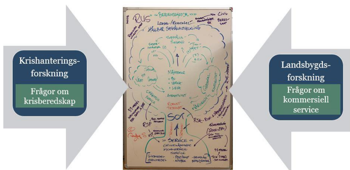
Figur 5, illustrerar de många inramningsmöjligheter som finns vad gäller SOT.

Som konstaterades inledningsvis i den här rapporten finns det en stark tendens inom forskning att krisforskare intresserar sig för frågor om olika påfrestande samhällsstörningar eller kriser och sällan anläggs ett explicit landsbygdsperspektiv. Forskare som skapar förståelse för villkoren i olika landsbygder och kartlägger spänningar mellan centrum – periferi gör det å andra sidan sällan med kriser eller krisberedskap i åtanke. Efter att följt arbetet med SOT, och talat med representanter från både den lokala och regionala nivån är det slående hur det något oklara förhållandet mellan dessa två perspektiv också är framträdande i såväl policydiskussioner som i det praktiska arbetet med SOT.