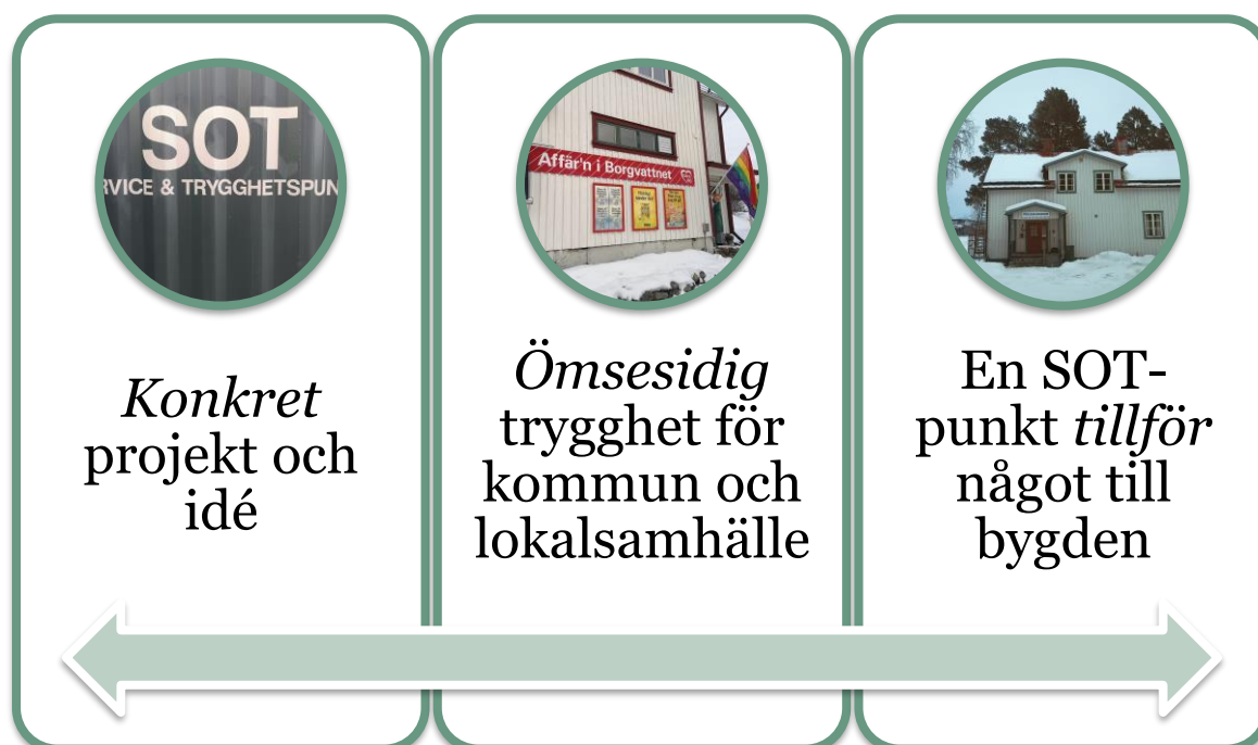
Figur 4, sammanfattar intervjupersonernas uppfattningar om vad som är de främsta förtjänsterna med SOT-punkter