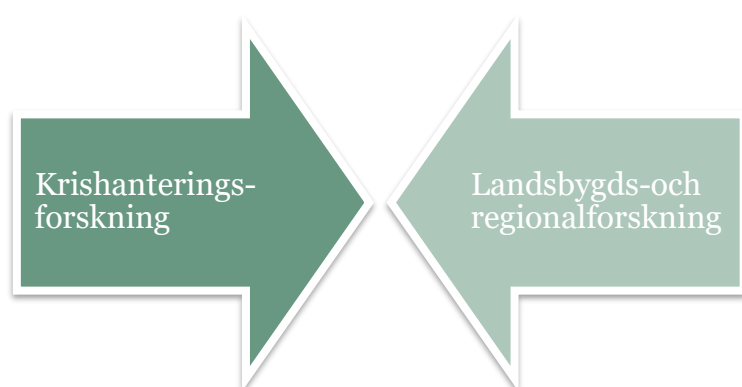
Figur 2, illustrerar hur forskning om kriser och krisberedskap å ena sidan, och forskning om landsbygder och regional utveckling, å andra sidan, ofta sker i två separata fält.

För att förstå hur tillgång till grundläggande kommersiell service genom exempelvis SOT-punkter både tryggar vardagen och är viktigt för att stärka lokal krisberedskap är det flera fält av forskning som är relevanta. Samverkansprojektet har haft som ambition att vara vetenskapligt innovativt genom att kombinera två forskningsfält som vanligtvis inte informerar varandra, närmare bestämt krisberedskap- och krishanteringsforskning i relation till landsbygds- och regionalforskning.