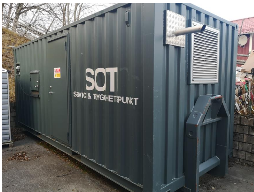
Bild 3, visar en SOT-container belägen i nära anslutning till en livsmedelsbutik och drivmedelsanläggning

långsiktighet ” (Intervju, Åre kommun). Mot den bakgrunden var en majoritet av intervjupersonerna positivt inställda till att en SOT-punkt är väl definierad och primärt stationär till sin karaktär.