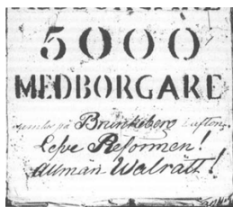
Fig. 1 Bild av plakat som spikats upp under natten mot den 18 mars 1848. Notera hur plakatet uppmanar till reform och allmän valrätt. Bilden publicerad ursprungligen i Mats Berglunds avhandling, s. 349.

Den typen av politisk oro fick följder för synen på politisk representation i Sverige, och behovet av att modernisera den politiska styrningen genom en ny representation framstod som allt viktigare, inte minst för att bevara samhällsordningen. 12