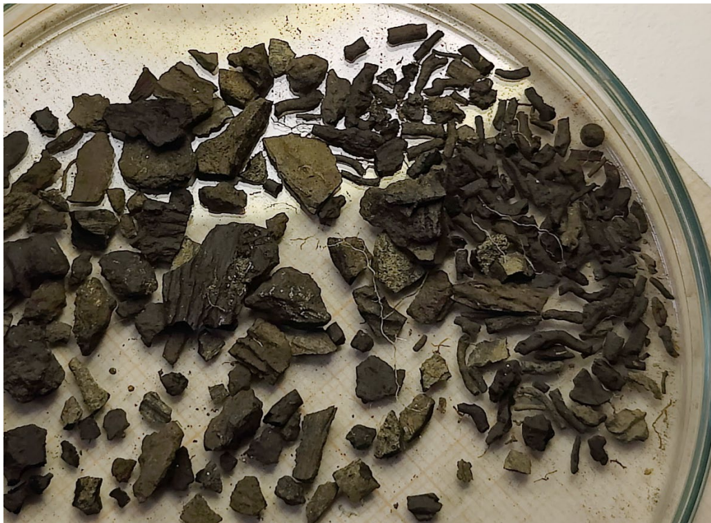
Bild 1. Bitar av harts med avtryck och rötter från P5023