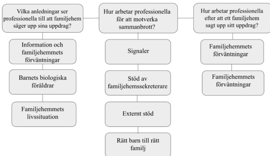
Tabell som illustrerar teman kopplat till varje frågeställning